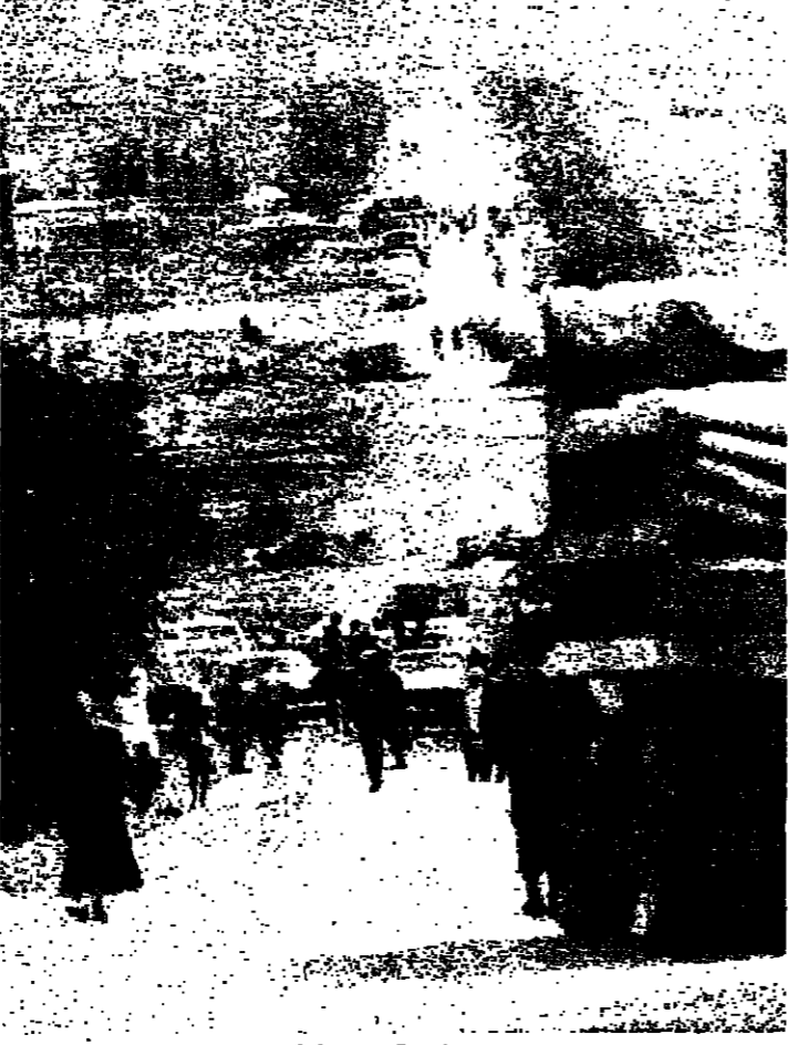
معبر النسيمة كما بدا أمس